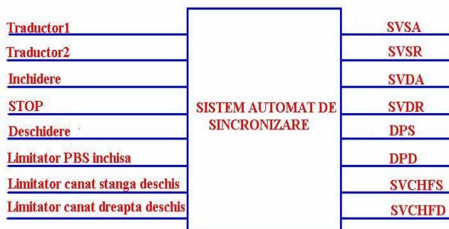
SCHEMA BLOC A AUTOMATULUI DE SINCROZARE